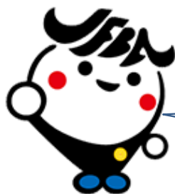
日弁連広報キャラクター ジャブバ